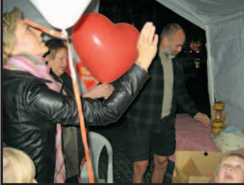
Der var mange børn i Kulturnatten, de elskede de røde hjerteballerer og musikken både fra LFS koret og fra spillemændene.