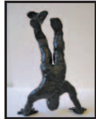
Vandrepokalen til en politiker med hjerte og engagement er skabt af udviklingshæmmede kunstnere, og den endelige pokal bliver lavet i bronze. Men hvem skal have den?