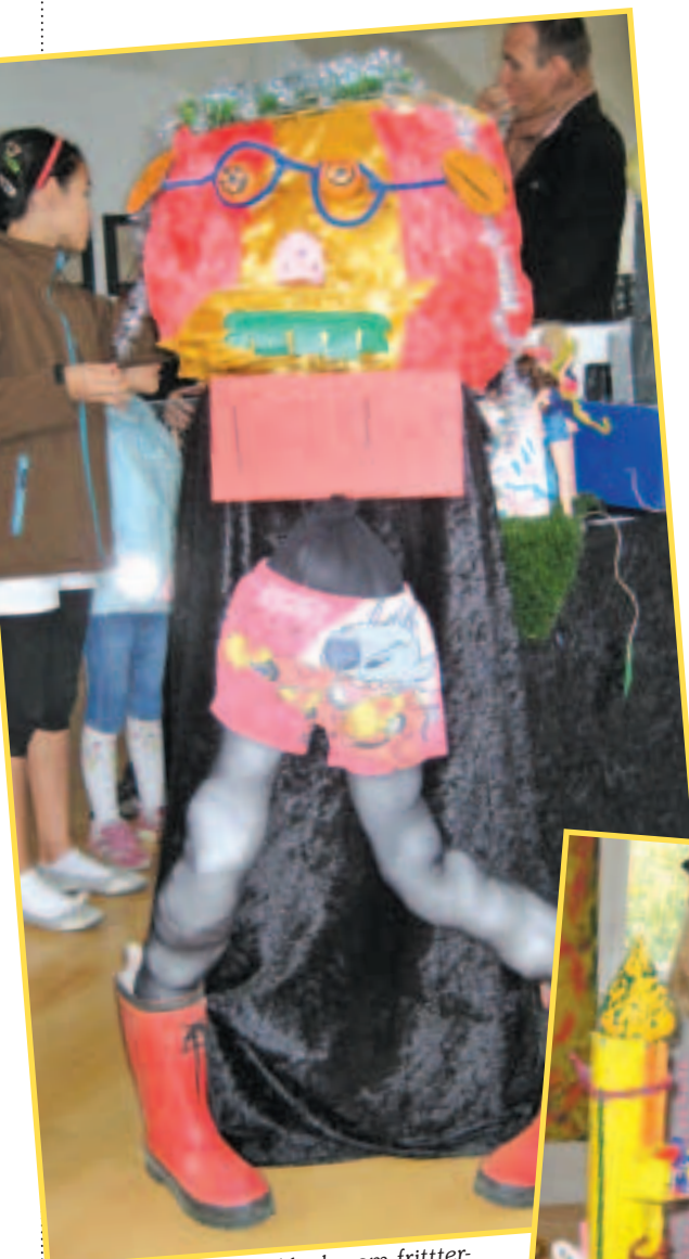
Forældrene flokkedes om fritter-tusindbenet, som "gik" fra den ene ende af salen til den anden.