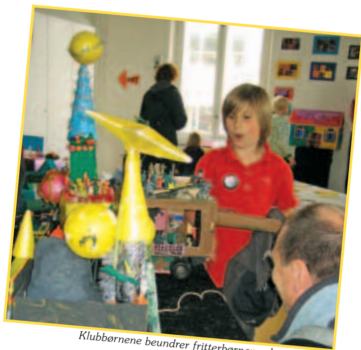
Klubbørnene beundrer fritterbørnenes kunstværker.

For 20. gang holder børnene i Dr. Caroline Amalie fernisering. Ligeså kreativt og fantasifuldt som altid ser de på deres virkelighed og former den til små og store kunstværker.