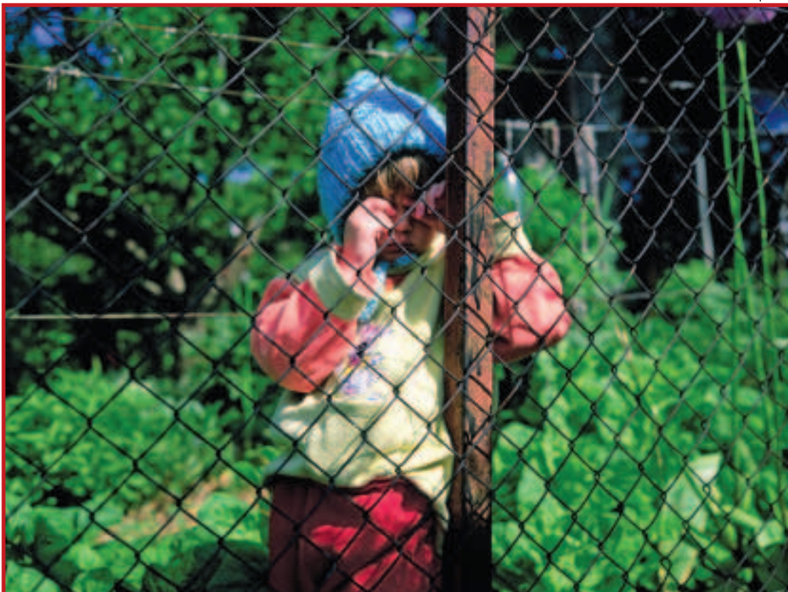
Kampagnen Tag signalerne alvorligt fra Ankestyrelsen har haft som resultat, at fagfolk er blevet langt mere bevidste om deres særlige ansvar for at handle, når de er bekymrede for et barn.

Men alt tyder ifølge Ankestyrelsen på at fagfolk faktisk tager deres underretningspligt alvorligt. Nye tal fra styrelsen viser, at der i de tre første kampagnemåneder næsten var en fordobling i antallet af underretninger til Ankestyrelsen sammenlignet med de tre foregående måneder. I de tre første kampagnemåneder modtog Ankestyrelsen 133 underretninger om udsatte børn og unge. En stikprøve tyder også på, at der i forbindelse med kampagnen er et stigende antal fagfolk, som henvender sig til Ankestyrelsen. Mens fagfolk i 2008 stod for cirka en femtedel af underretningerne, står de efter kampagnens start for cirka en tredjedel af det stigende antal underretninger.